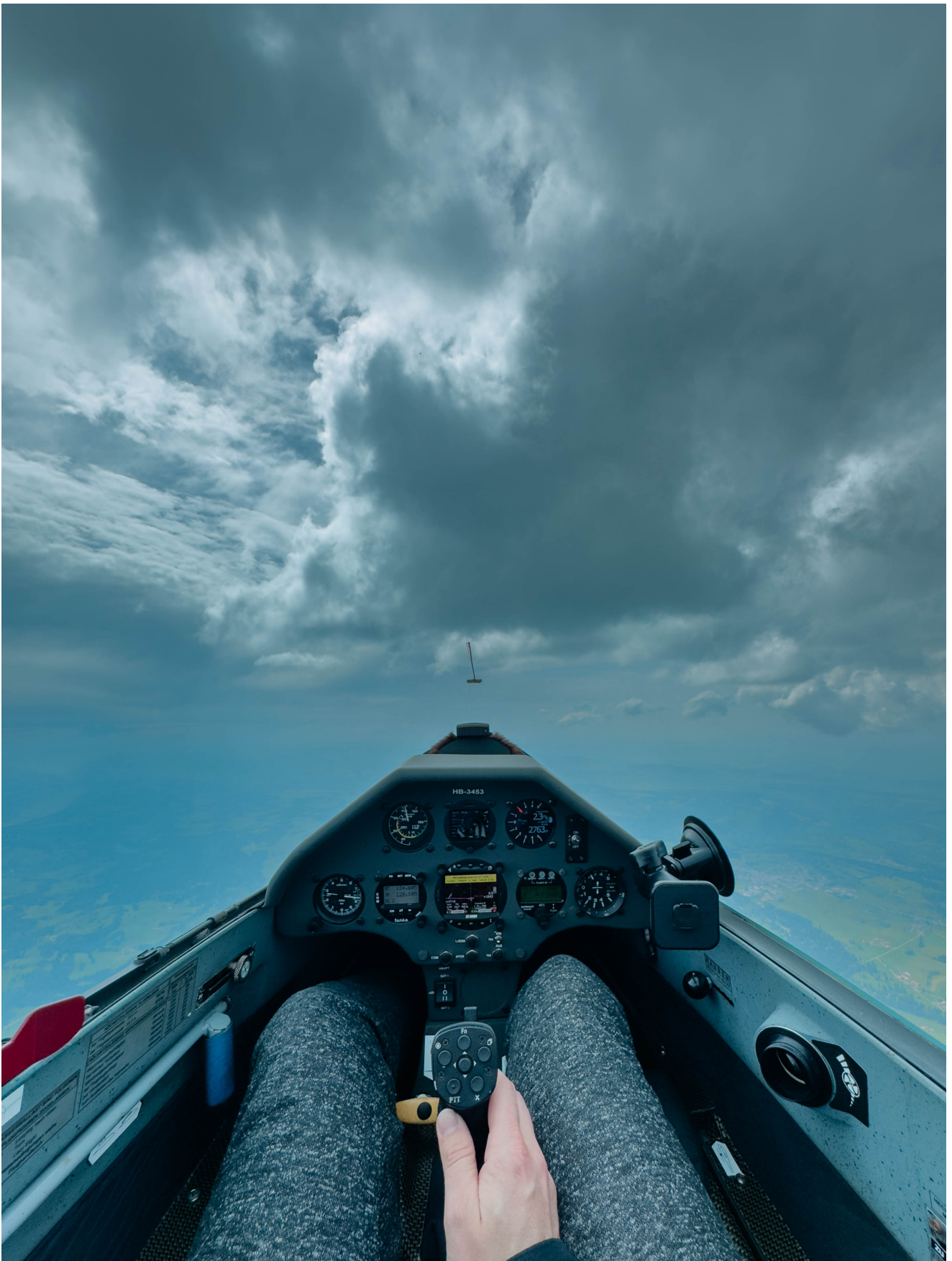
Bild 7: Hat sich der Winter einmal verzogen, fliegt es sich schon fast von alleine.